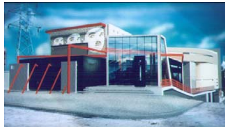
El nuevo edificio de la cinemateca

Sin embargo, la tarea de archivo de la cinemateca no se limita a las películas, sino más bien se extiende a todo material cinematográfico. Esto comprende libros especializados, folletos, recortes de prensa, catálogos, afiches, revistas, fotos y diapositivas, todos debidamente catalogados y organizados en salas específicas.